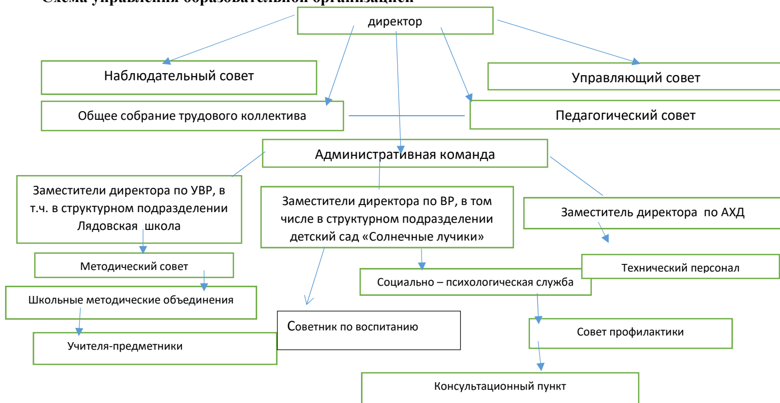
Схема управления образовательной организацией

По итогам 2023 года система управления школой оценивается как эффективная, позволяет учесть мнение всех участников образовательных отношений. Изменение системы управления в 2024 году не планируется.